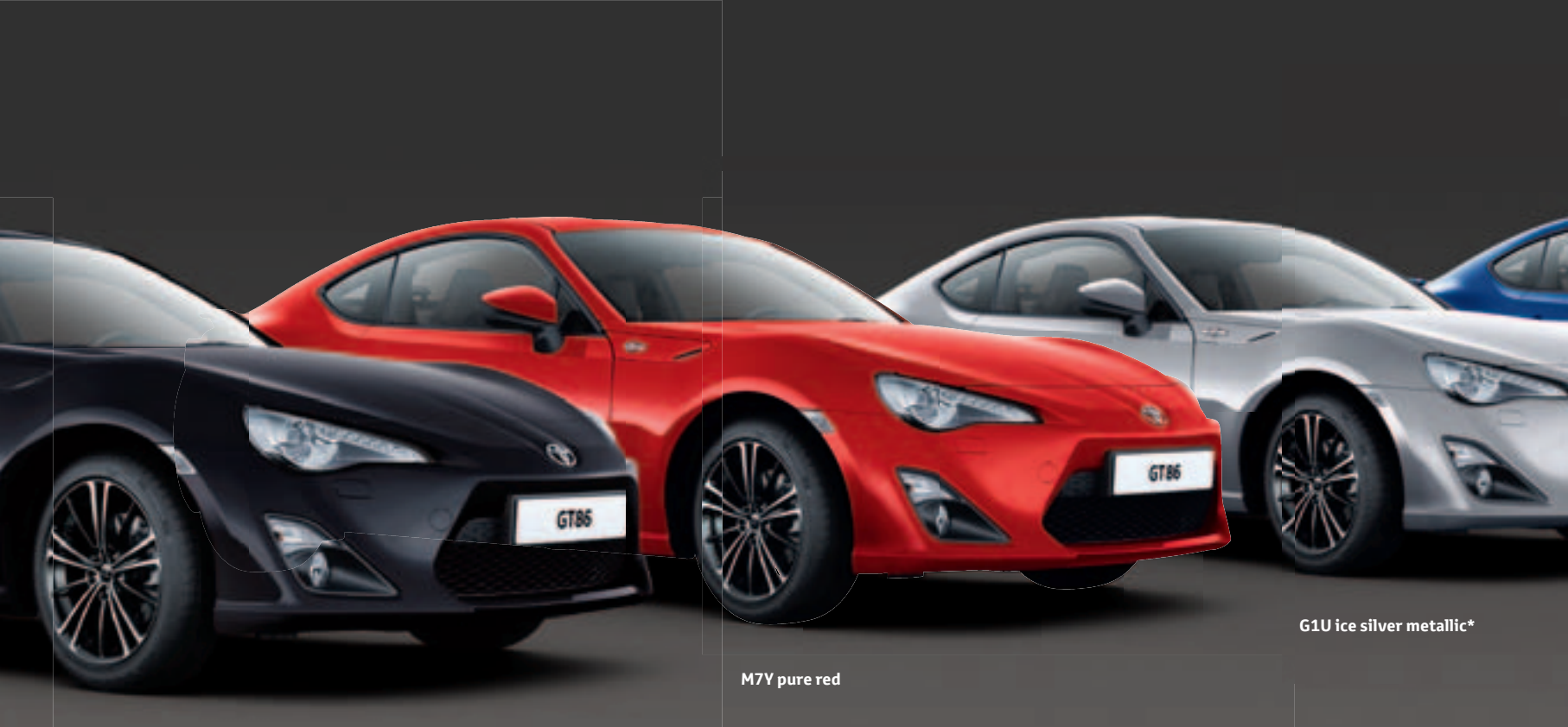
D4S furious black metallic*