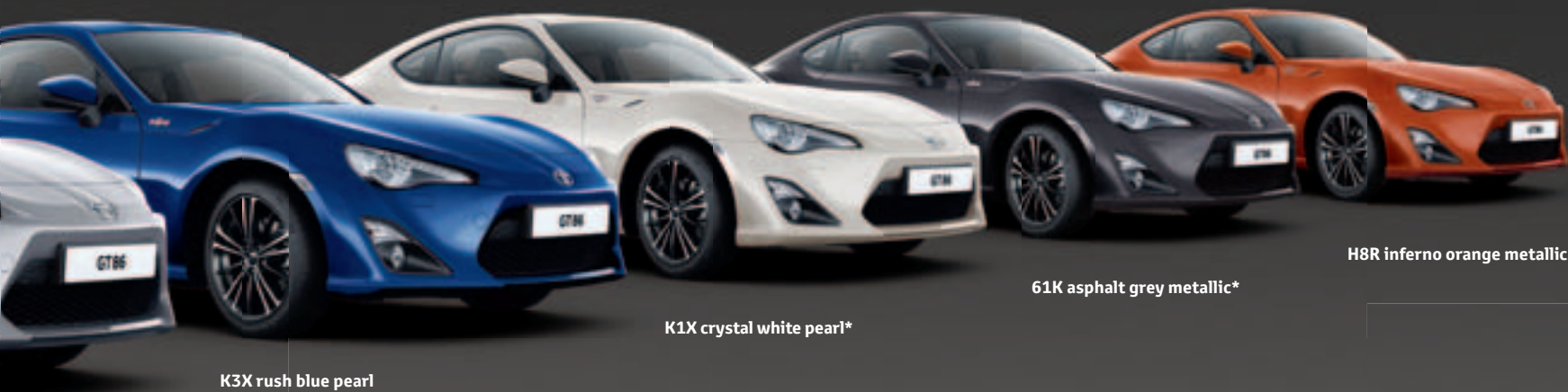
K3X rush blue pearl