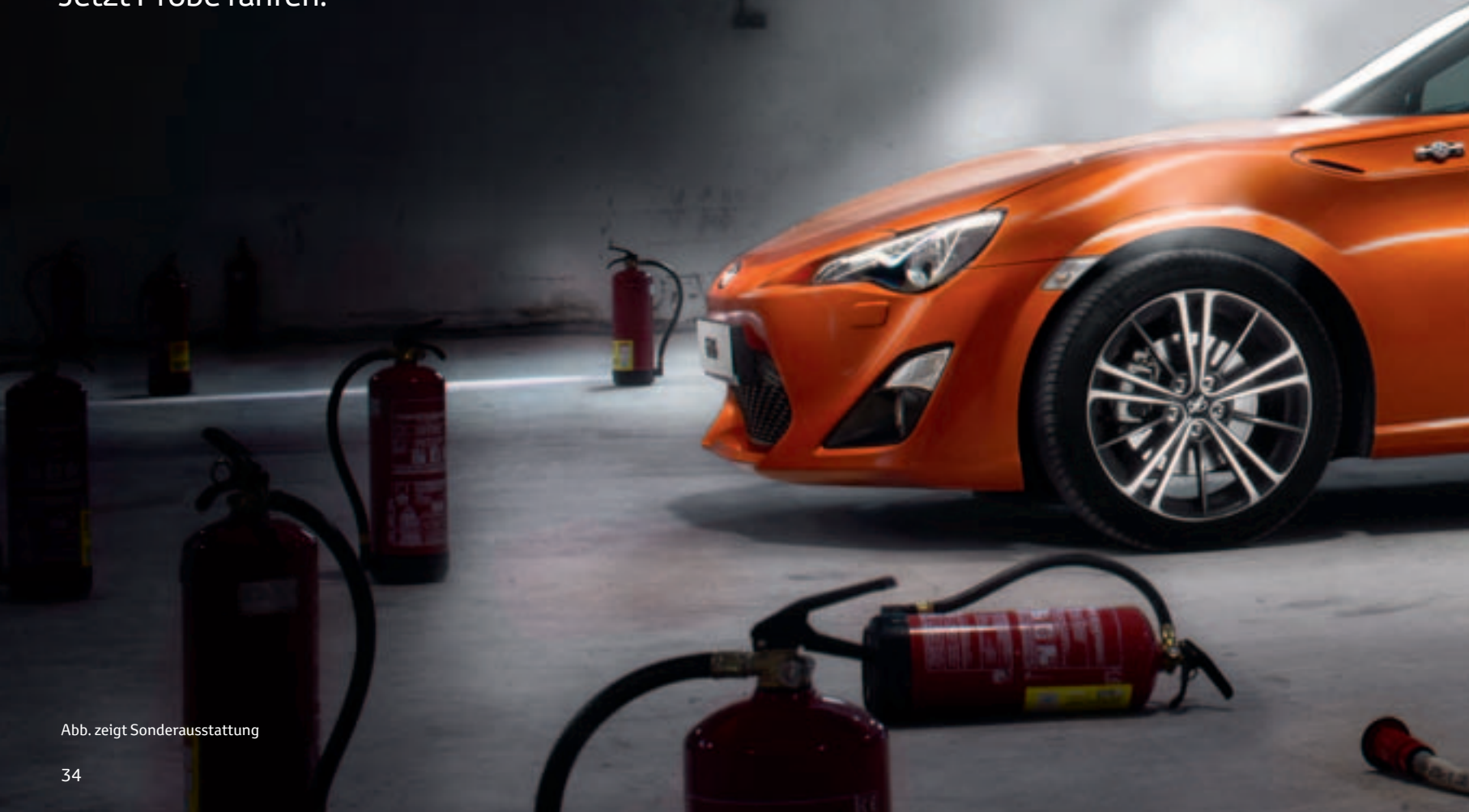
Abb. zeigt Sonderausstattung

Der GT86 wartet schon auf Sie. Jetzt Probe fahren.